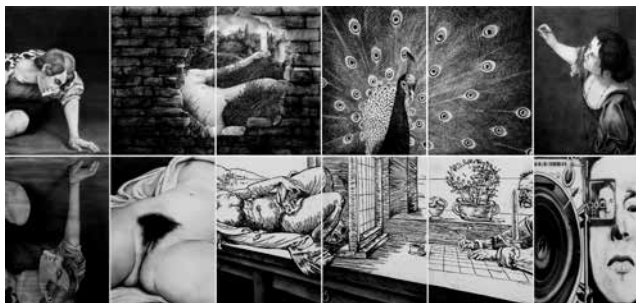
GEGEBEN SEI, 2019 – Museum der Schatten [Caravaggio, Marcel Duchamp, Artemisia Gentileschi, Gustave Courbet, Albrecht Dürer, Dsiga Wertow] Öl, Kohle/Papier, 12-teilig, je 100 × 70 cm, gesamt 202 × 430 cm

GEGEBEN SEI besteht aus zwölf Einzelmotiven, die zentrale Momente der Kunst- und Mediengeschichte aufnehmen und in Beziehung setzen. Jedes Motiv greift ein ikonisches Werk auf und untersucht Strategien von Sichtbarkeit, Reflexion, Körperlichkeit und Perspektive. Zusammen entsteht ein Tableau, in dem historische und mediale Referenzen in einen assoziativen Dialog treten.