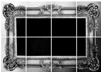
EINFRIEDUNG, 2025 – Museum der Schatten Kohle/Papier, 8-teilig, je 100 × 70 cm, gesamt 202 × 286 cm

Rainer Wölzl entwickelt seit den frühen 1980er-Jahren seine »Malerei des Verschwindens«, ein Konzept, in dem Bild, Medium und inhaltliche Reflexion untrennbar verbunden sind. EINFRIEDUNG zeigt diese Grundhaltung in konzentrierter Form: eine Auseinandersetzung mit Sichtbarkeit, Abgrenzung und Leere. Im Zentrum des Tableaus steht eine große, tief-schwarze Fläche, die den Blick auf sich zieht und einen Raum für Reflexion eröffnet. Die monochrome Fläche greift die Tradition der modernen Schwarzmalerei auf, wie sie von Ad Reinhardt oder Pierre Soulages entwickelt wurde: Schwarz fungiert hier nicht nur als Farbe, sondern als Raum, Atmosphäre und Erfahrung, die das Unsichtbare, Vergessene oder nur indirekt Wahrnehmbare thematisiert. Ein kunstvoll gestalteter Rahmen markiert und begrenzt die Leere, während die acht Blätter der Komposition durch sichtbare Fugen die fragmentierte Konstitution von Wahrnehmung, Erinnerung und Geschichte erfahrbar machen. Der Titel EINFRIEDUNG verweist auf das Einhegen, Abstecken und Begrenzen eines Raums, doch