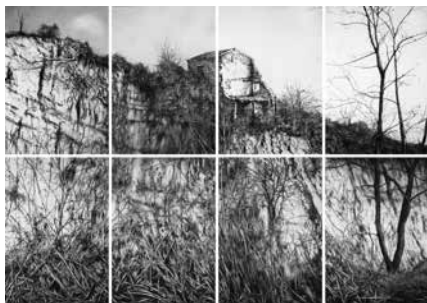
ABGRUND, 2025 – Museum der Schatten Kohle/Papier, 8-teilig, je 100 × 70 cm, gesamt 202 × 286 cm

ABGRUND zeigt eine karge Landschaft: Auf einem steilen Hang steht ein verwittertes, teilweise verfallenes Haus, von dem ein Teil abgestürzt erscheint, umgeben von kahlen Bäumen und dichtem Gestrüpp. Im Vordergrund verdichten sich Gräser und Zweige zu einem dunklen Liniengeflecht, während der helle Himmel einen starken Kontrast zur expressiven Kohlezeichnung bildet. Die fragmentierte Anordnung der einzelnen Blätter lässt die Landschaft wie aus einzelnen Wahrnehmungsfeldern zusammengesetzt erscheinen.