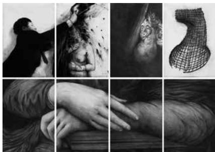
AKTION MONA, 2016 – Museum der Schatten [Rudolf Schwarzkogler, Johann Heinrich Füssli, Leonardo da Vinci] Kohle/Papier, 8-teilig, je 100 × 70 cm, gesamt 202 × 286 cm